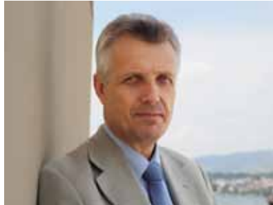
Pfr. Martin Junge, Generalsekretär des LWB

Das vorliegende Grundsatzpapier zur Genderngerechtigkeit im LWB, das 2013 vom LWB-Rat verabschiedet wurde, ist ein Instrument, um den Weg der Gemeinschaft hin zu Inklusion zu unterstützen. Es wurde in einem partizipatorischen Prozess erarbeitet, ist aus Erfahrungen der Mitgliedskirchen erwachsen, durch die biblischen und theologischen Grundsätzen unserer lutherischen Identität abgerundet und bietet Orientierung und Methodik, um Aktionspläne und -strategien an den jeweiligen lokalen Kontext anzupassen und Gender als übergreifende